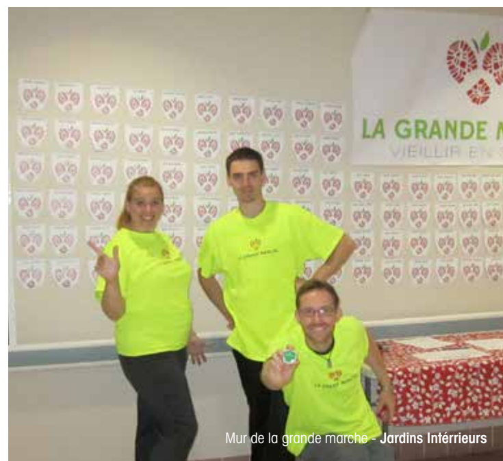
Mur de la grande marche - Jardins Intérieurs