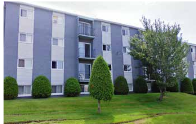
Le Mézy - Sherbrooke