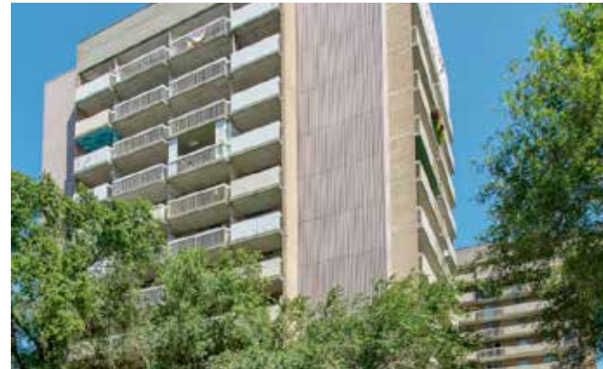
Place Papineau - Montréal