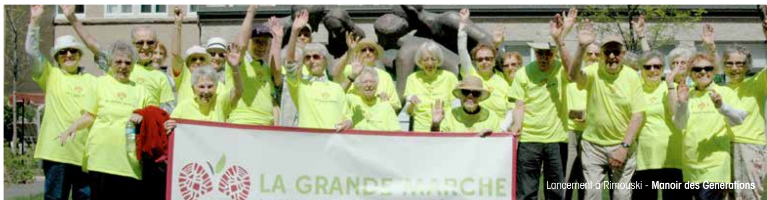
Lancement à Rimouski - Manoir des Générations

Dans le cadre du programme Vieillir en santé , les résidences privées pour aînés AZUR et JAZZ ont organisé une activité à grande échelle afin faire bouger et rassembler les aînés du Québec. Du 10 juin au 6 septembre 2013, La Grande marche vieillir en santé regroupe des clubs de marche dans l'ensemble des résidences privées pour aînés AZUR et JAZZ. Spécialement formés pour l'occasion, ces clubs de marche comptent des marcheurs volontaires qui parcourront des distances propres à la forme physique de chacun. En date du 10 juin, jour de lancement, plus de 1,500 marcheurs étaient inscrits!