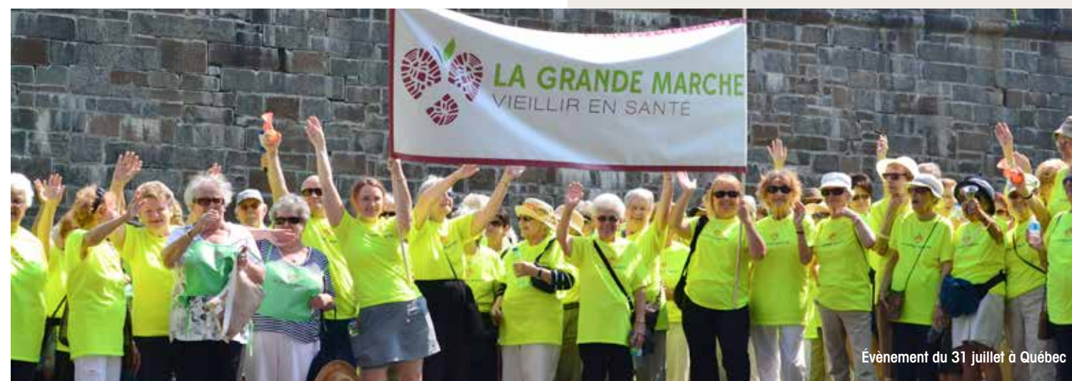
Événement du 31 juillet à Québec

La Grande marche vieillir en santé regroupe l'ensemble de ces facteurs en une activité rassembleuse ayant un objectif commun.