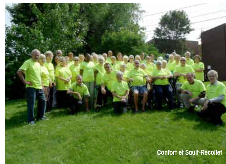
Confort et Saut-Récollet