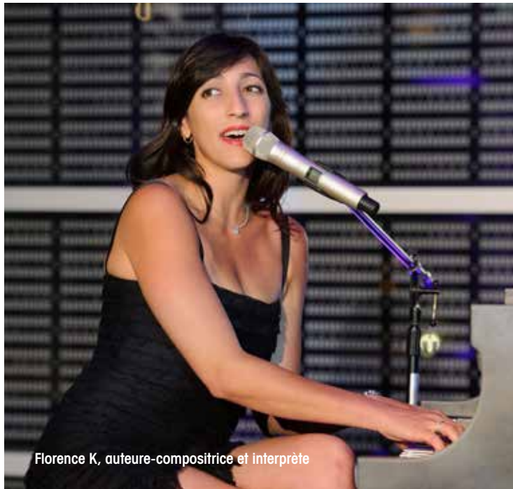
Florence K, auteure-compositrice et interprète