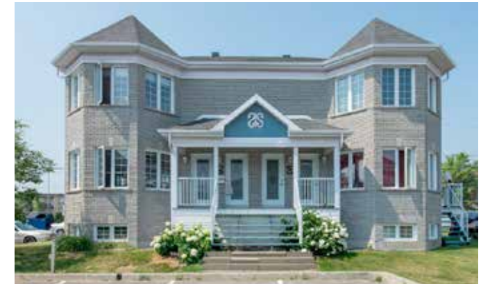
Le Domaine Brugnon - Québec