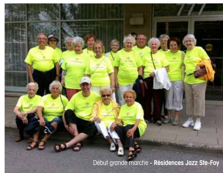
Début grande marche - Résidences Jazz Ste-Foy