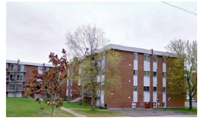
Loretteville - Québec