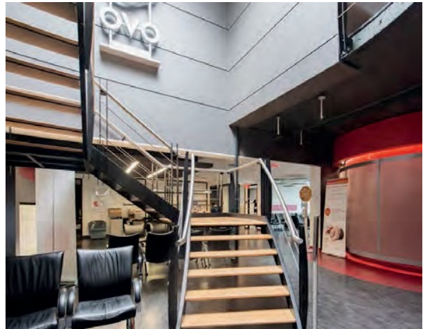
Stairs 2 nd floor