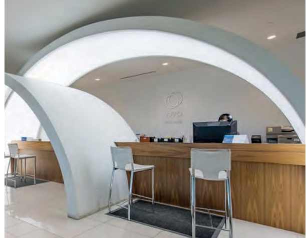
Clinique Ovo office