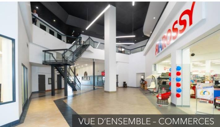
VUE D'ENSEMBLE - COMMERCES