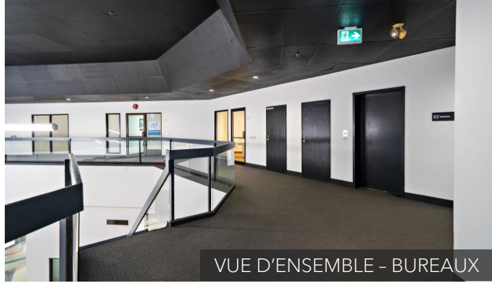
VUE D'ENSEMBLE - BUREAUX