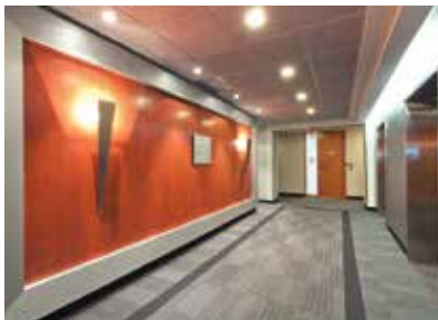
Espace commun (étage)