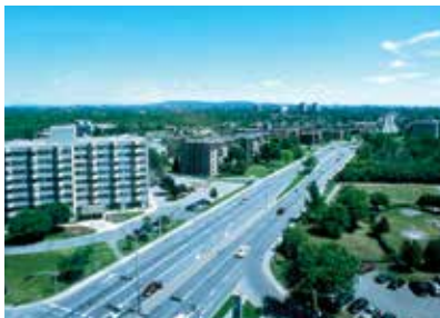
Vue aérienne de l'édifice