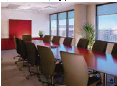
Salle de conférence