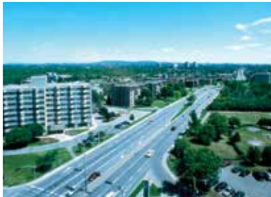
Vue aérienne de l'édifice