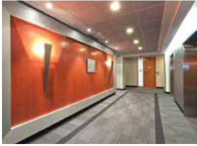
Espace commun (étage)