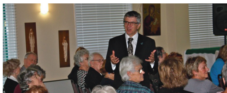
Résidence Le St-Patrick, Québec 2 novembre 2012