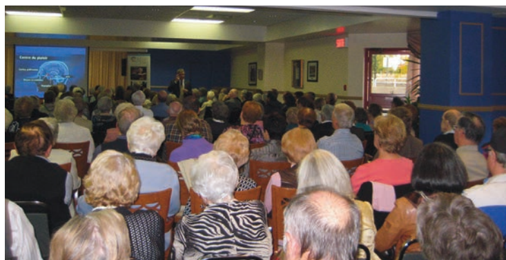
Jardins de Renoir, Laval 21 octobre 2012

Le premier bloc de conférences, qui portait sur le diabète et la santé cardiovasculaire a connu un énorme succès! Au total, plus de 1000 participants ont assisté aux conférences qui ont eu lieu le 21 octobre aux Jardins de Renoir, le 26 octobre au Complexe Gouin-Langelier, le 28 octobre aux Jardins Intérieurs et finalement le 2 novembre au St-Patrick.