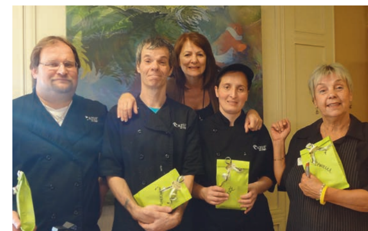
Domaine des Forges