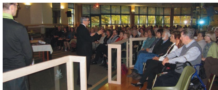
Jardins Intérieurs, Saint-Lambert 28 octobre 2012