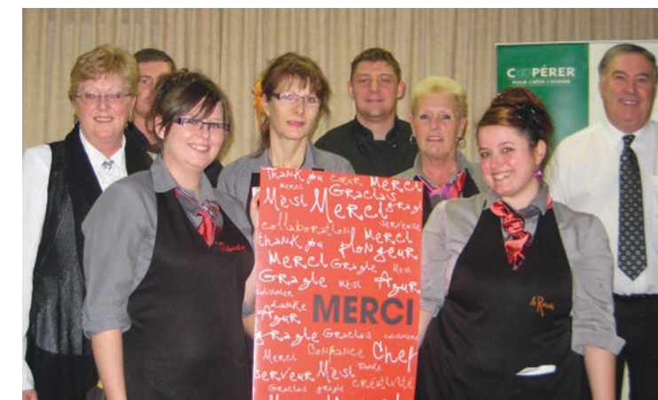
Jardins de Renoir