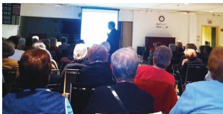
Complexe Gouin-Langelier, Montréal-Nord 26 octobre 2012