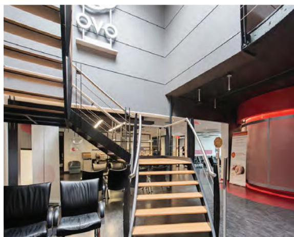
Escaliers vers 2 e étage