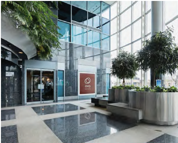
Lobby de granit