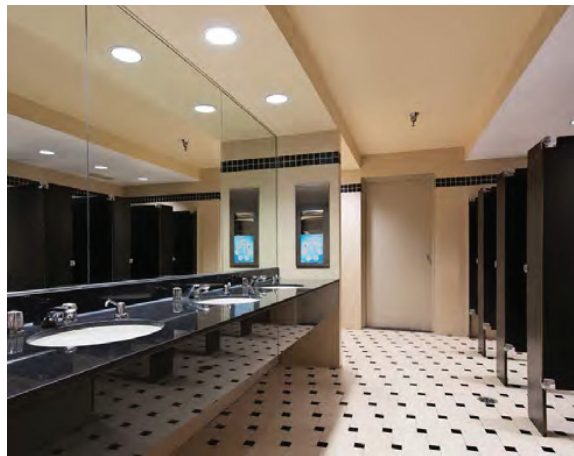
Salle de toilettes