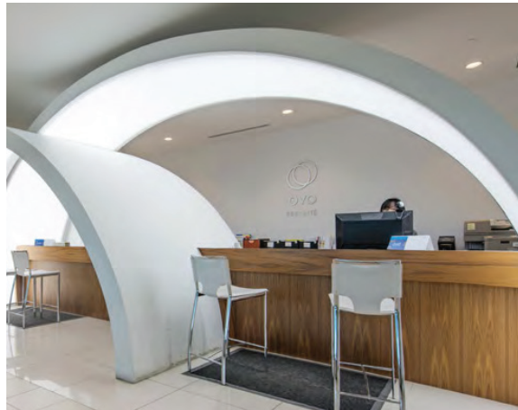
Bureaux de Clinique Ovo