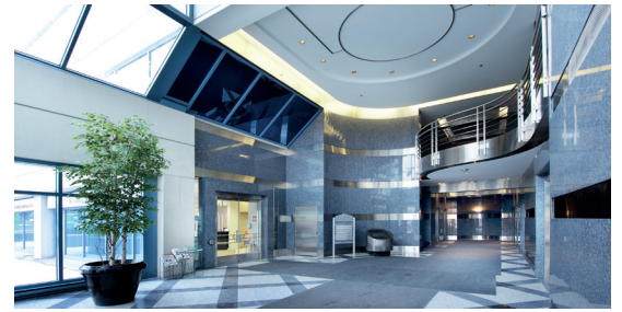
Lobby de style Art déco avec mezzanine