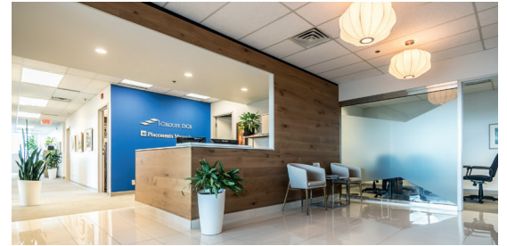
Espaces modernes et rénovés