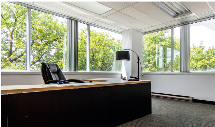
Bureaux avec fenestration abondante