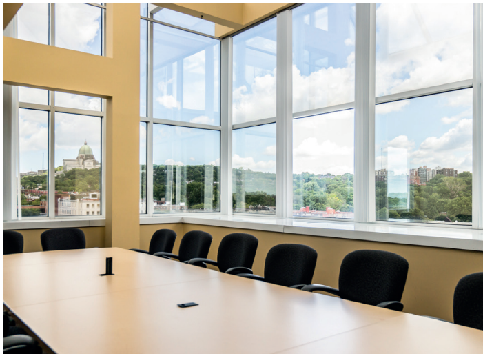
Vue imprenable sur le Mont-Royal