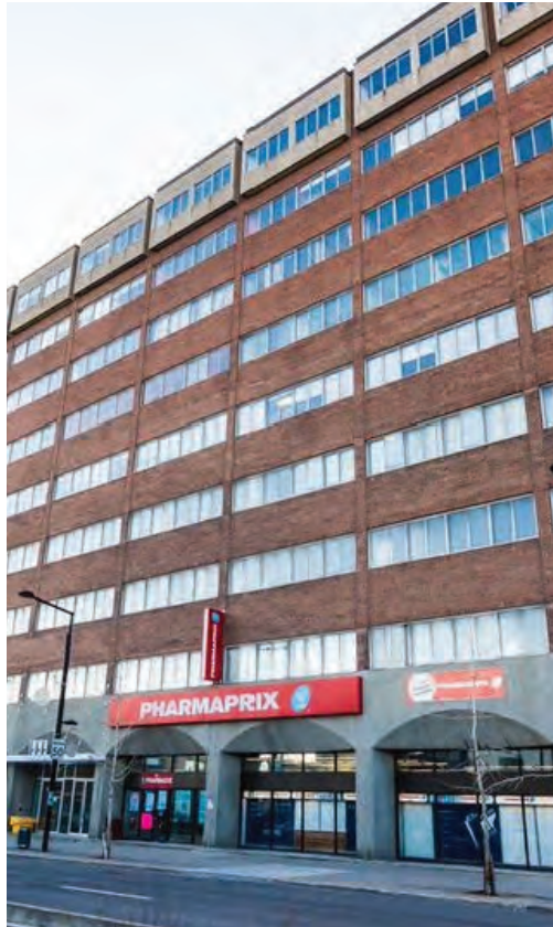
Façade (vue de côté)