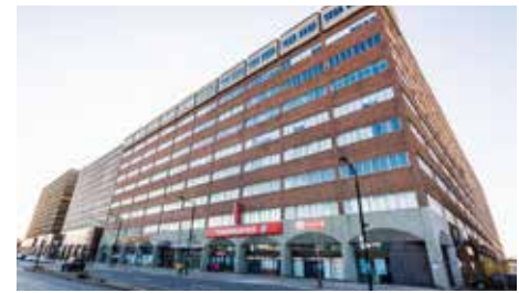
333, rue Chabanel