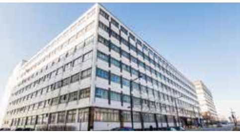
99, rue Chabanel