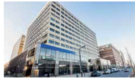
433, rue Chabanel