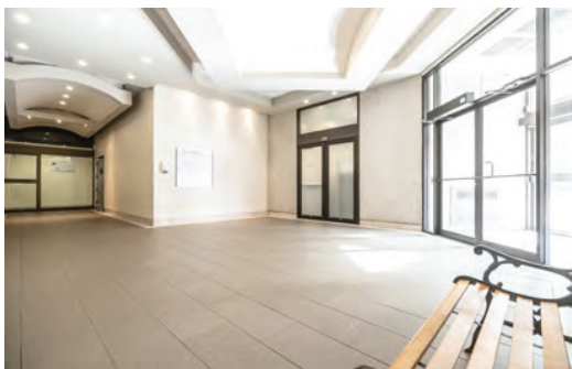
Hall d'entrée rénové