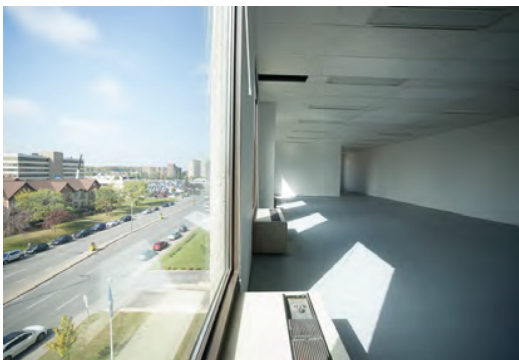
Vue depuis l'édifice