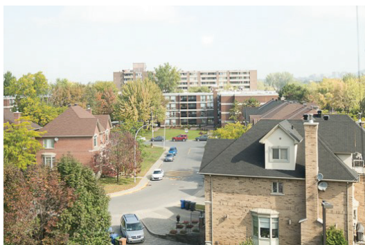
Vue depuis l'édifice