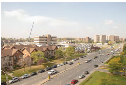
Vue depuis l'édifice