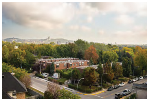
Vue depuis l'édifice