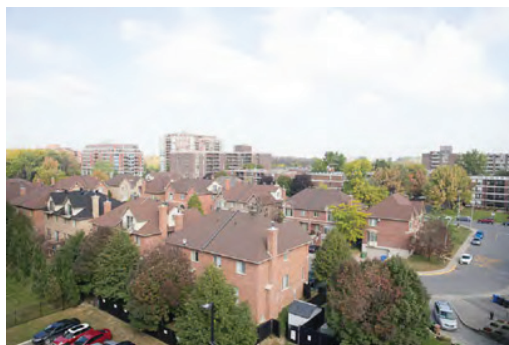
Vue depuis l'édifice