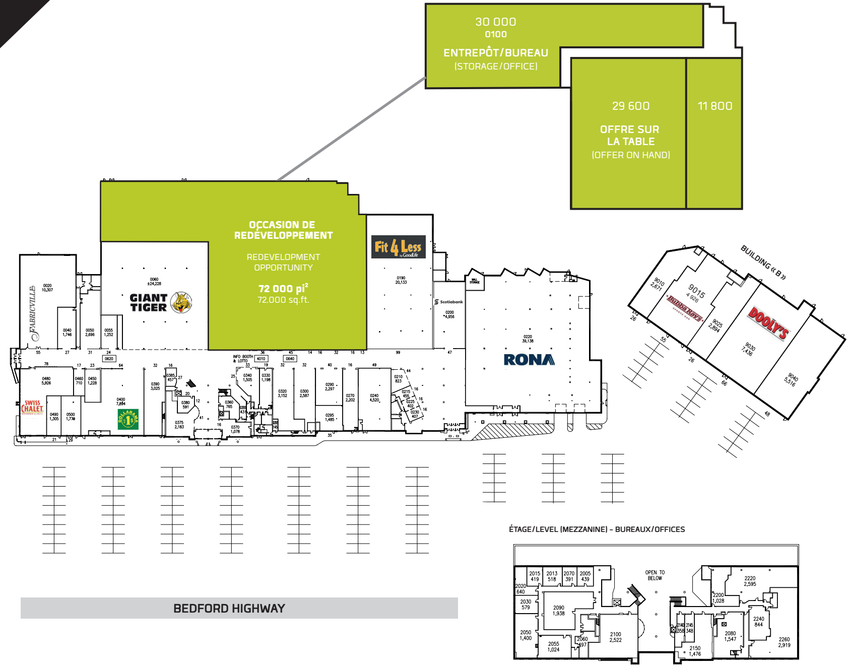
ÉTAGE/LEVEL (MEZZANINE) - BUREAUX/OFFICES